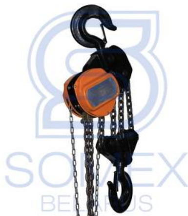
ТРШС-10,0 "Профлайн" (РФ)