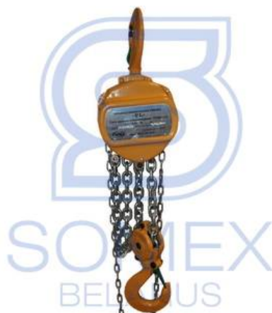
ТРШС-5,0 "Профлайн (РФ)"