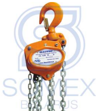
ТРШС-5,0 "Мастер" (РФ)