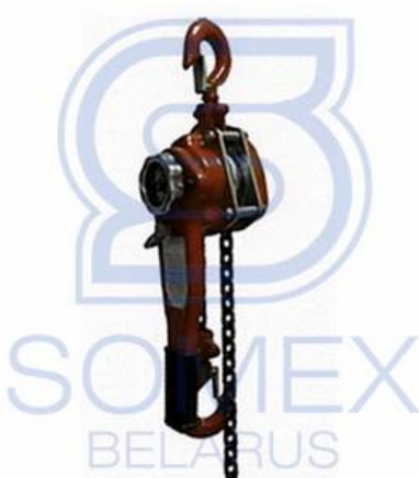
TRШС-1,0 "Мастер" (РФ)