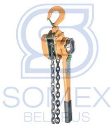
TRCP-1,0 "Профлайн" (РФ)