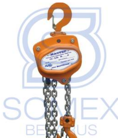
ТРШС-0,75 "Мастер" (РФ)