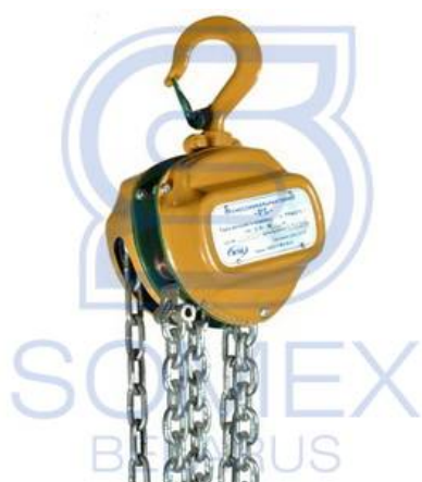
ТРШС-0,75 "Профлайн" (РФ)